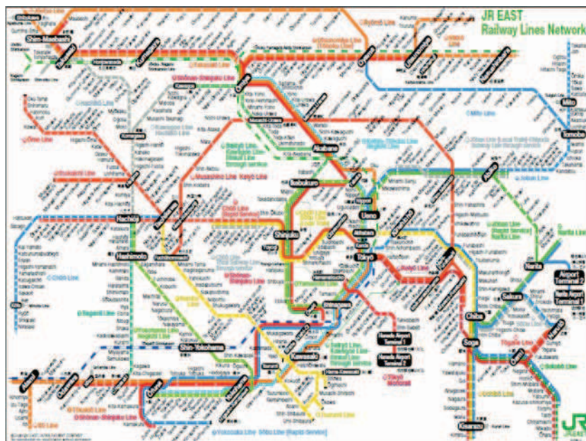
Figura 2. Mappa della JR East.

Queste due tappe, contrassegnate da due timbri all'interno dell'area ovale, svolgono un ruolo importante nell'innescare il pellegrinaggio stesso, in quanto fanno parte del tessuto urbano centrale e sono facilmente raggiungibili dagli utenti. La loro visita apre però alla sequenza dei percorsi possibili, che man mano si allontanano sempre più dal centro urbano fino all'esplorazione delle aree periferiche più esterne.