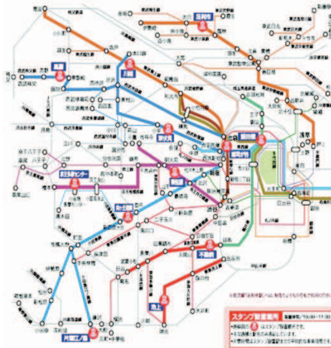
Figura 1. Mappa dello Yururi sansaku (edizione “autunno-inverno” 2009).

Partiamo dunque dall’analisi della mappa di questo pellegrinaggio, dalla sua organizzazione visiva vista come un sistema (Fig. 1).