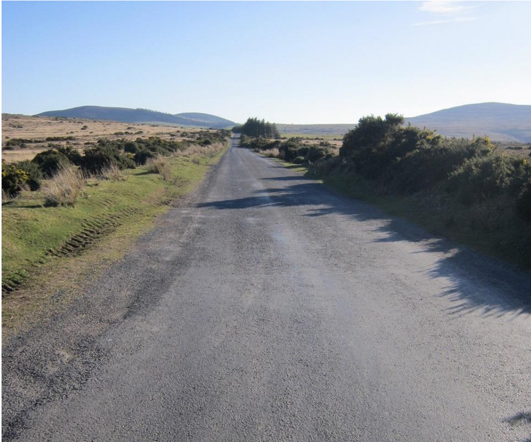
Bóthar Bhreo inniubh